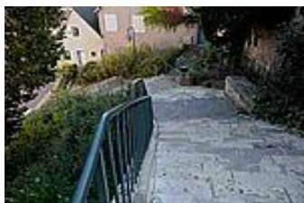
Le Tertre de la Poissonnerie

Ce tertre résulte de la réunion des tertres aux Rats et du Petit-Cerf rendue possible par la démolition des maisons, vers 1885. On peut avoir une pensée émue pour les porteurs d'eau « évier et évières » d'autrefois qui devaient gravir cette pente pour approvisionner la haute ville en eau de la fontaine Saint-André. Les marches qui facilitent aujourd'hui la montée ont été installées en 1815.