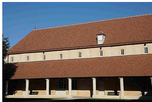
Actuelle école nationale de musique et de danse

Lors du siège de 1568, le couvent des cordeliers apparaît comme dangereux pour la sécurité de la ville : il pourrait donner asile aux assiégés. Le 3 mars, M. de Linières, gouverneur de Chartres donne donc ordre de le détruire. Lorsque le siège est achevé, les Cordeliers ne réintègrent pas leur couvent qui reste en ruine jusqu'en 1620, date à laquelle une petite chapelle est construite à son emplacement pour les habitants du faubourg (on l'appelle le Petit Saint-François ).