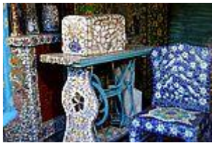
La cour noire

L'homme qui la construisit, de son vrai nom Raymond Isidore , fut surnommé Picassiette par dérision : on imagine la somme gigantesque de débris d'assiettes, de faïences et verres divers qu'il dut recueillir pour mener à son terme son entreprise ! Quand en 1930 Raymond Isidore entreprend la construction de sa maison, il ne pense alors aucunement à la décorer de quelque manière que ce soit. En 1935, il est embauché comme cantonnier par la Ville de Chartres ; il sera affecté comme balayeur au cimetière Saint-Chéron à partir de 1949 et y restera jusqu'à sa retraite.