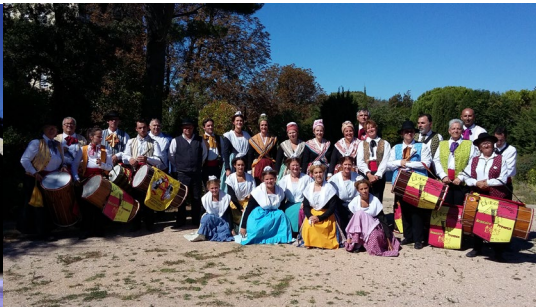
Les Enfants d'Aramon