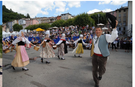
L'Étincelle Sieyenne La Bélugue