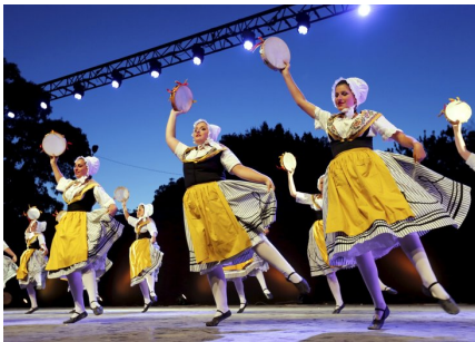
Le Roudelet Félibren

10 h 00 Début des Aubades en centre-ville