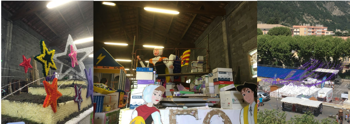
Construction de chars dans le hangar

Fête foraine (dans les 10 première de France) ouverte dès l'après-midi jusqu'au soir