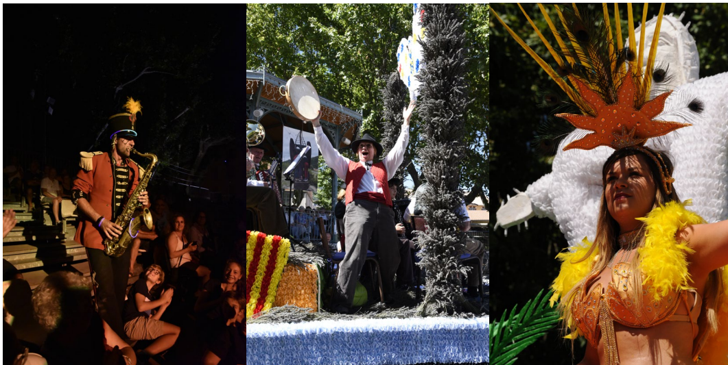
Distillerie de lavande