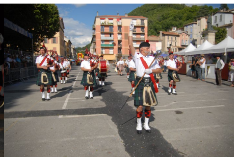
Red Hackel Pipe Band