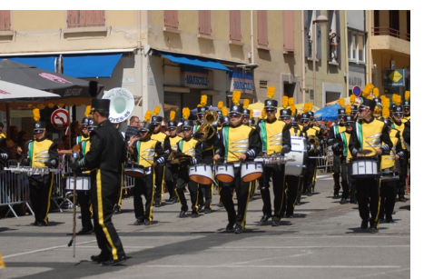
Les Sans Piston