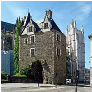
Porte Saint-Pierre , vestige de l' ancienne enceinte de la ville

Les premiers aménagements urbains encore visibles de nos jours remontent à l' époque médiévale , les constructions datant du Haut Empire romain ayant été recouvertes par des aménagements postérieurs 39 . La ville médiévale fortifiée d'autrefois correspond au quartier du Bouffay . Il subsiste également la porte Saint-Pierre , le château des ducs de Bretagne , ainsi que quelques maisons à colombage et hôtels particuliers datant pour l'essentiel du xv e siècle .