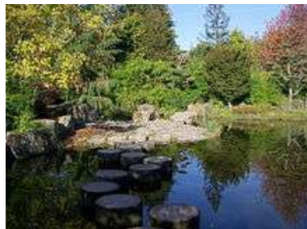
Aperçu du jardin japonais de l'île de Versailles

Le jardin japonais de l'île de Versailles offre un paysage de rocailles, de cascades, de plans d'eau, entourés de bambous , cerisiers du Japon , rhododendrons , camélias et cyprès chauves