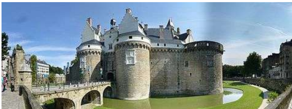
Entrée du Château entre les tours du Pied-de-Biche et de la Boulangerie.

Le château des ducs de Bretagne est situé sur la rive droite de la Loire dans le centre-ville de Nantes. Il était la résidence principale des ducs de Bretagne du xiii e au xv e siècle. C'est une forteresse constituée de sept tours reliées par des courtines. La cour possède plusieurs bâtiments datant des xv e , xvi e et xviii e siècles dont la résidence ducale construite en pierre de tuffeau