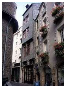
Maisons de la rue Sainte-Croix