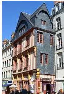
La maison des Apothicaires , place du Change .