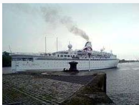
Le paquebot britannique Black Prince en escale à Nantes le 30 avril 2009.

Actuellement, la société d'économie mixte Nantes-métropole gestion équipements, sous l'enseigne Les 3 ports , gère trois zones principales d'accueil des bateaux de plaisance, dont une est à Nantes. Cette zone comprend deux sites en centre-ville : l' Erdre ( bassin Ceineray et bassin Malakoff ) et la Loire ( ponton Belem et ponton des chantiers ).