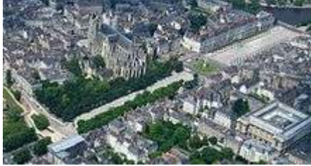
Les cours Saint-Pierre et Saint-André.

En 1972 , la ville a délimité un secteur sauvegardé compris entre le quai de la Fosse et les cours Saint-Pierre et Saint-André et incluant notamment le château , la cathédrale , le quartier du Bouffay , l' île Feydeau , la place Royale et le quartier Graslin .