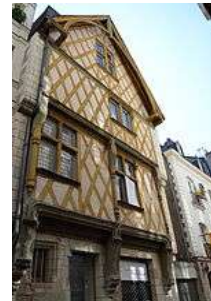
Maison de la rue de la Juiverie