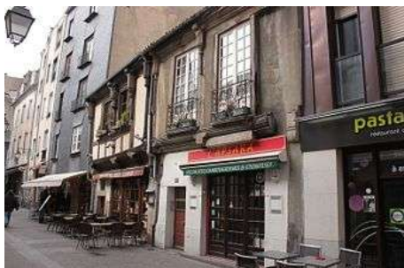
Maisons de la rue de la Bâclerie