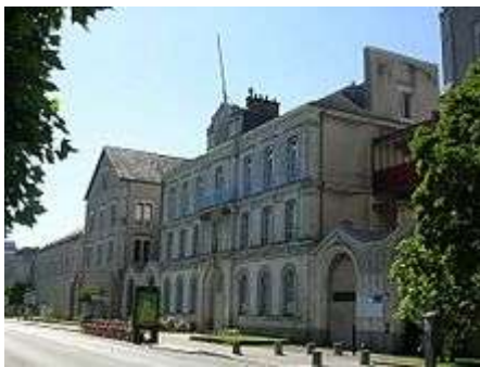
L'ancienne Manufacture des tabacs .

Le passé industriel de la ville lui a légué un patrimoine important, notamment la biscuiterie LU devenue Le Lieu unique .