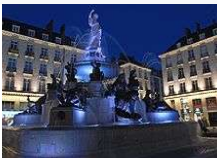
La fontaine de la place Royale .

Le quartier médiéval du Bouffay , proche du château et de la cathédrale, à l'intérieur des limites de l' ancienne enceinte , date du xv e siècle . Il abrite un ensemble de maisons aux façades à pans de bois, à colombages et à encorbellements, ou reconstruites en pierre au xviii e siècle dans le parcellaire médiéval.