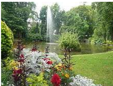
Le Jardin des plantes.

Nantes a obtenu quatre fleurs avec distinction Grand Prix aux palmarès 2006 et 2007 du concours des villes et villages fleuris . Le Service des espaces verts et de l'environnement de la ville de Nantes (SEVE) recense 95 parcs, jardins, cours, places et squares sous sa responsabilité.